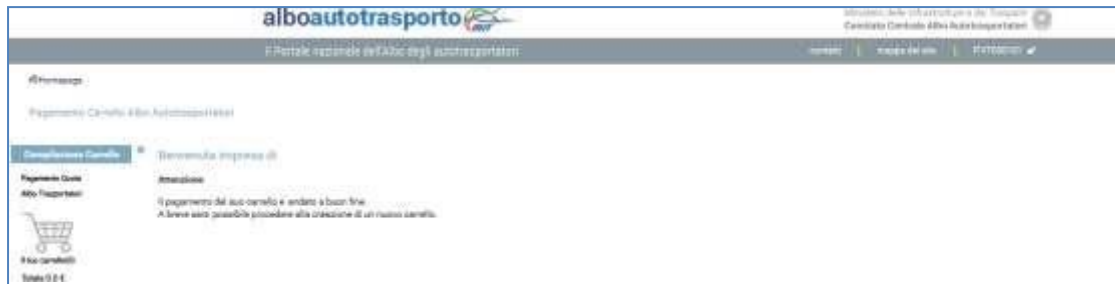
Figura 3 - Messaggio di Warning nel caso di Carrello pagato ma non ancora finalizzato

Nel caso in cui invece il carrello risulti pagato ma non ancora finalizzato (caso in cui per problemi tecnici vi è un disallineamento tra la componente applicative e la base dati), il sistema visualizza una pagina di errore come mostrata in Figura 3. L'utente deve attendere la finalizzazione del pagamento prima di poter procedere con la creazione di un nuovo carrello.