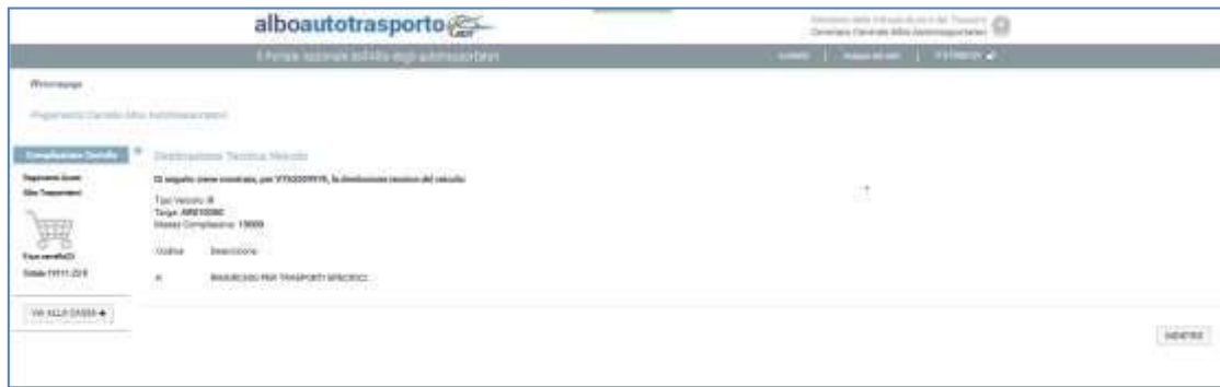
Figura 10 - Destinazione tecnica veicolo