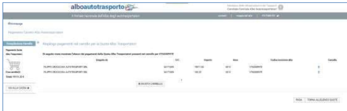
Figura 12 - Riepilogo carrello

Premendo il pulsante "Continua" il sistema provvede ad inoltrare il carrello al sistema di pagamento.