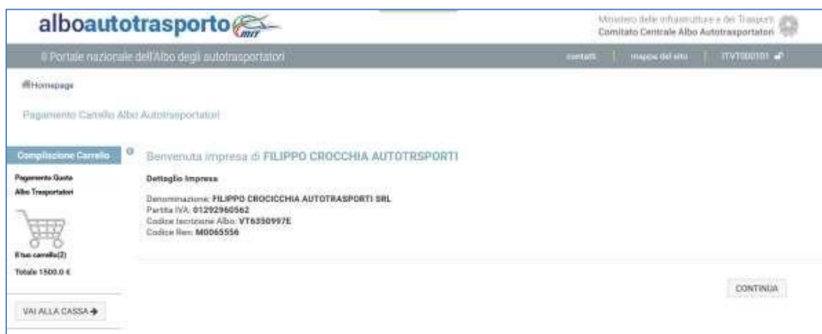
Figura 1 - Dettaglio Impresa di Trasporto Conto Terzi

L'elenco delle quote albo associate all'impresa sono accessibile dall'utente Impresa anche cliccando su apposito pulsante "Visualizzazione Quote".