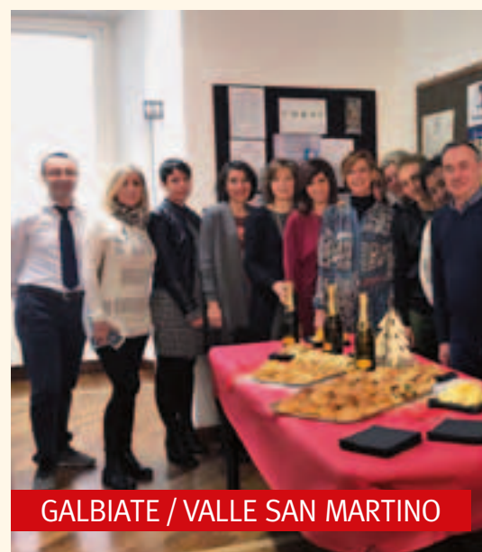
GALBIATE / VALLE SAN MARTINO