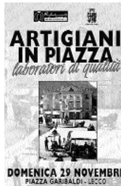
Un'immagine della manifestazione Artigiani in piazza

del territorio lombardo, combattendo concretamente il fenomeno dell'abusivismo e del commercio di articoli contraffatti. La manifestazione ha costituito un'occasione per accogliere il pubblico e far toccare