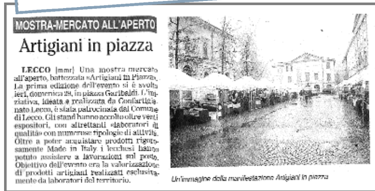
MOSTRA-MERCATO ALL'APERTO Artigiani in piazza

LECCO [mmr] Una mostra mercato all'aperto, battezzata «Artigiani in Piazza». La prima edizione dell'evento si è svolta ieri, domenica 29, in piazza Garibaldi. L'iniziativa, ideata e realizzata da Confartigianato Imprese Lecco, è stata patrocinata dal Comune di Lecco. Gli stand hanno accolto oltre venti espositori, con altrettanti laboratori di qualità con numerose tipologie di attività. Oltre a poter acquistare prodotti rigorosamente Made in Italy i leccesi hanno potuto assistere a lavorazioni sul posto. Obiettivo dell'evento era la valorizzazione di prodotti artigiani realizzati esclusivamente da laboratori del territorio.