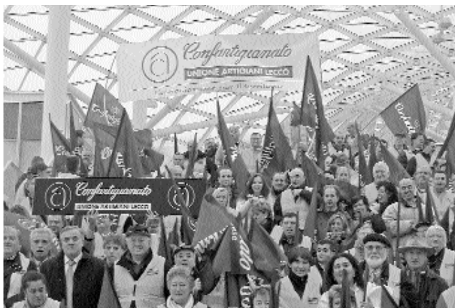
In un'immagine d'archivio, la manifestazione degli artigiani lecchesi per un fisco più giusto nel 2006.