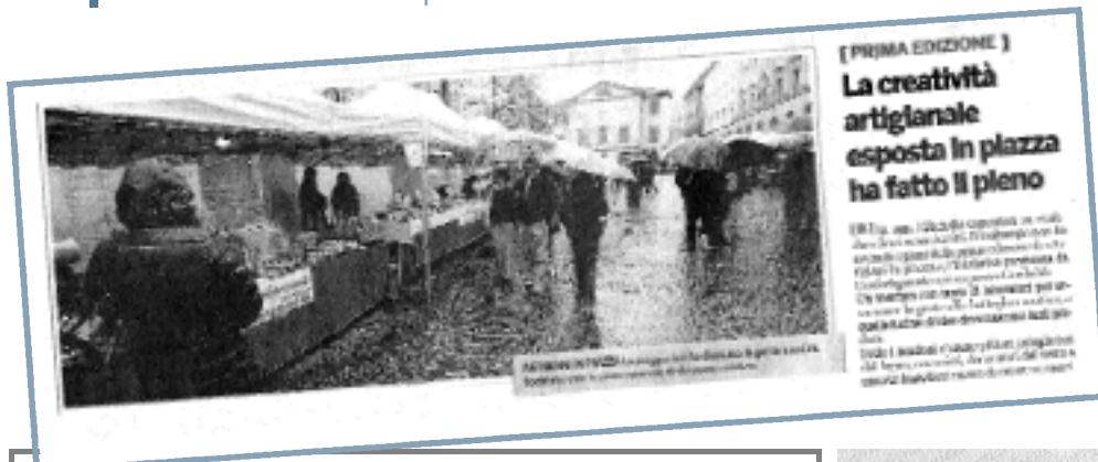
[PRIMA EDIZIONE] La creatività artigianale esposta in piazza ha fatto il pieno

Obiettivo dell'evento è stato la valorizzazione di prodotti artigiani realizzati esclusivamente da laboratori