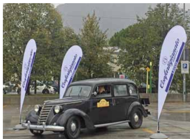
Sfilata bagnata, sfilata fortunata: un successo la partecipazione delle auto d'epoca organizzata dalla categoria Autoriparatori di Confartigianato Imprese Lecco alla MOMA