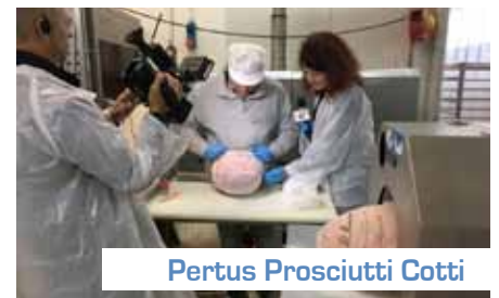
Pertus Prosciutti Cotti