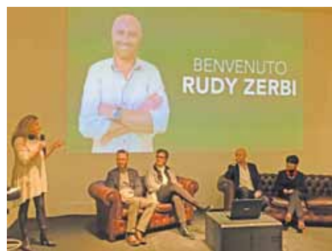
Ospite d'eccezione alla MOMA, Rudy Zerbi che ha intrattenuto il folto pubblico ricordando le sue origini artigiane