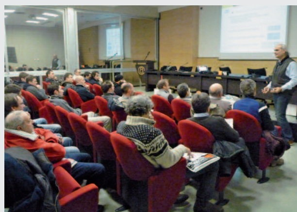
L'incontro del 16 gennaio scorso sul tema dell'umidità nelle murature, rivolto alla categoria dei Pittori edili.