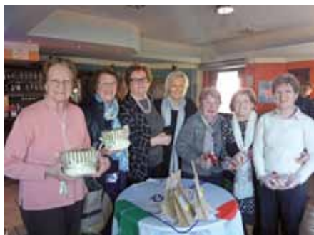
Le nostre campionesse di Burraco