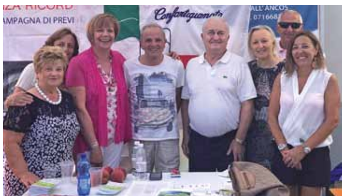
IV Edizione Trofeo Mazzoleni nell'ambito della "Barro Sky Night", il trofeo nasce in memoria di Alessandro Mazzoleni galbiatese scomparso nel 2014, in ricordo del quale si è formato un gruppo di volontari che fanno della solidarietà la loro missione