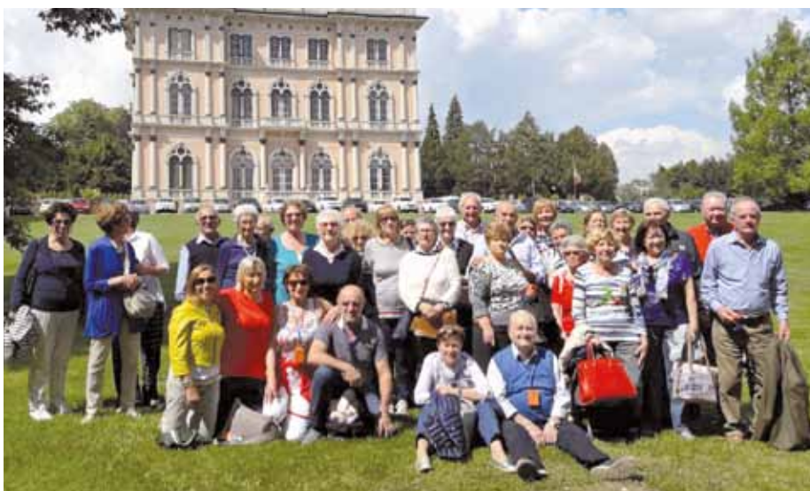
Foto di gruppo per la festa regionale di ANAP a Varese