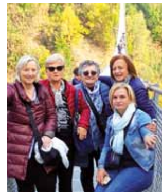
Le nostre donne sul Ponte Tibetano in Valtellina