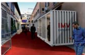
Italian Makers Village sorge in Via Tortona, una dei cuori pulsanti della creatività.

IMV ITALIAN EXPO 2015 MAKERS VILLAGE Italian Excellence, Food & Style