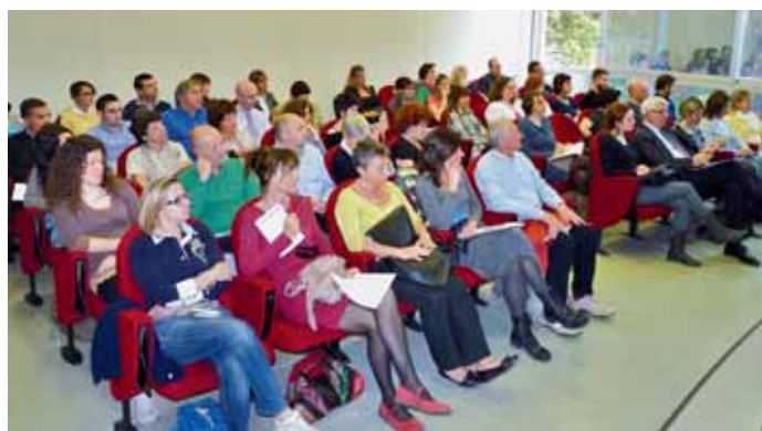
Qui sopra il tavolo dei relatori e la platea. Sotto, il servizio baby sitter con il laboratorio Art Attack.