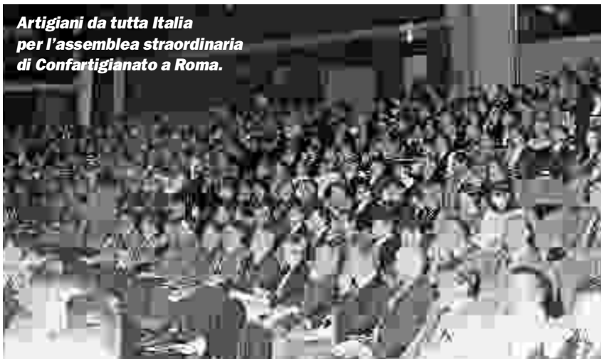
Artigiani da tutta Italia per l'assemblea straordinaria di Confartigianato a Roma.

'reale': è cioè, una espressione reale di reali interessi e di altrettanto reali valori economici, sociali e professionali. Recentemente, in una iniziativa pubblica, Confartigianato ha citato alcuni dati di estremo interesse su cui è riflettere: nel 2001 soltanto nel settore dell'artigianato sono nate circa 118.000 imprese, ma - al contempo - ne sono cessate circa 103.000.