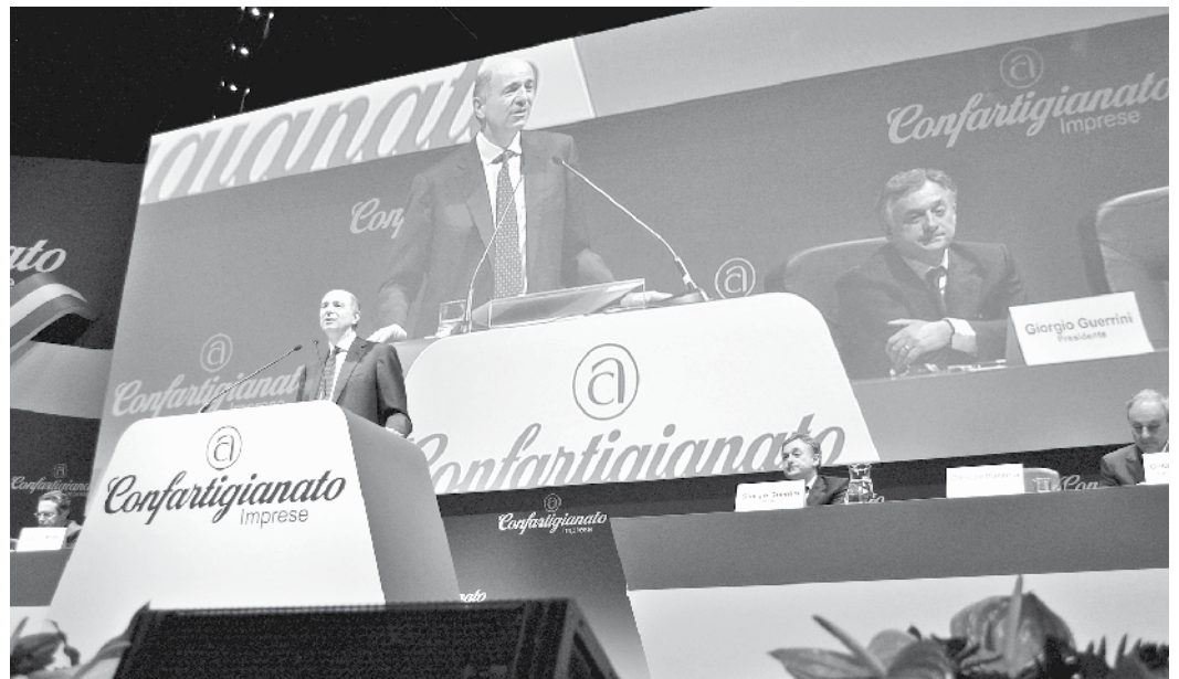
Il ministro Corrado Passera nel corso del suo intervento. Sullo sfondo il presidente nazionale Giorgio Guerrini.

Il compito di dare una risposta alle critiche e alle proposte degli artigiani è toccato al ministro dello Sviluppo Economico, profondo conoscitore della realtà delle piccole aziende. Passera ha esordito evi-