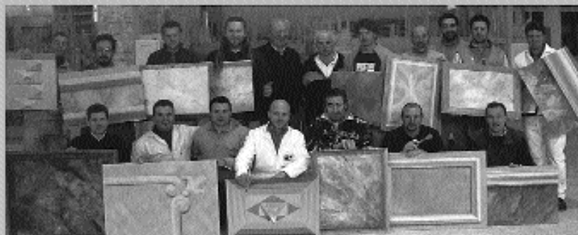
I partecipanti ad uno degli ultimi corsi organizzati da Confartigianato Lecco, con le loro realizzazioni.

Per informazioni sui prossimi corsi in programma, rivolgersi all'ufficio Formazione, tel. 0341.250200