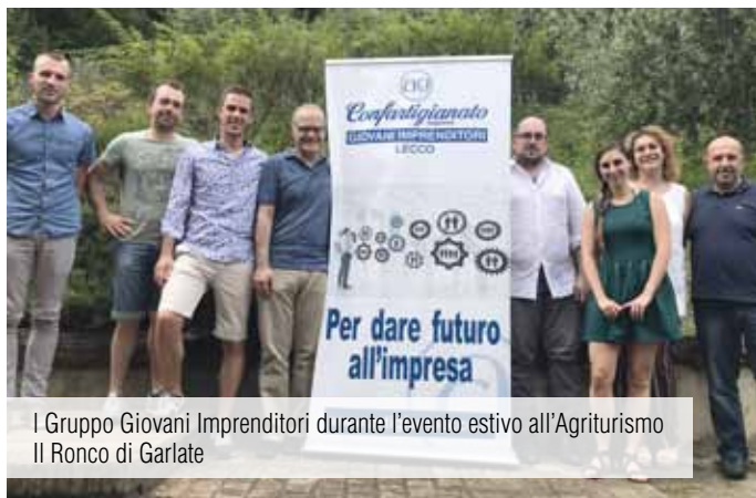
I Gruppo Giovani Imprenditori durante l'evento estivo all'Agriturismo Il Ronco di Garlate