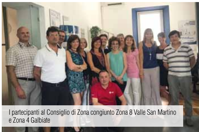
I partecipanti al Consiglio di Zona congiunto Zona 8 Valle San Martino e Zona 4 Galbiate