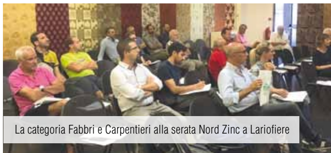
La categoria Fabbri e Carpenteri alla serata Nord Zinc a Lariofiere