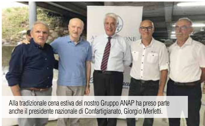
Alla tradizionale cena estiva del nostro Gruppo ANAP ha preso parte anche il presidente nazionale di Confartigianato, Giorgio Merletti.