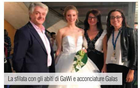
La sfilata con gli abiti di GaWi e acconciature Galas