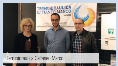
Termoidraulica Cattaneo Marco