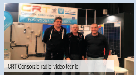
CRT Consorzio radio-video tecnici