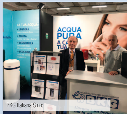
BKG Italiana S.n.c.