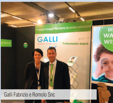
Galli Fabrizio e Romolo Snc