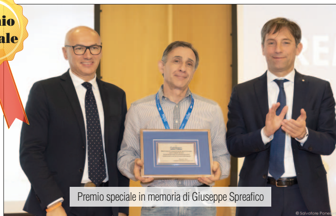
Premio speciale in memoria di Giuseppe Spreafico