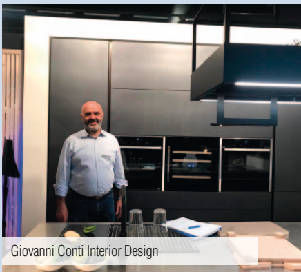
Giovanni Conti Interior Design