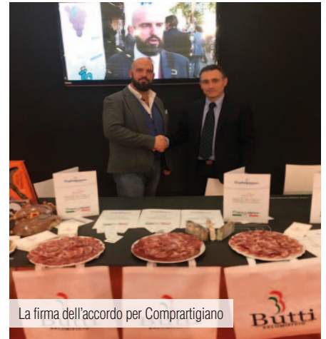
La firma dell'accordo per Comprartigiano