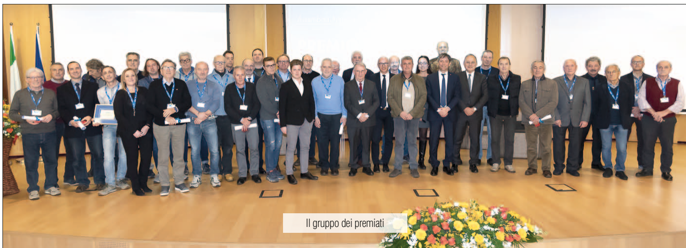
Il gruppo dei premiati