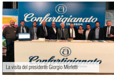
La visita del presidente Giorgio Merletti