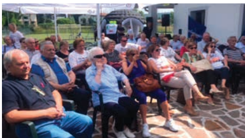
Con le Forze dell'Ordine abbiamo presentato il progetto anti-truffe realizzato da ANAP e Ministero dell'Interno.