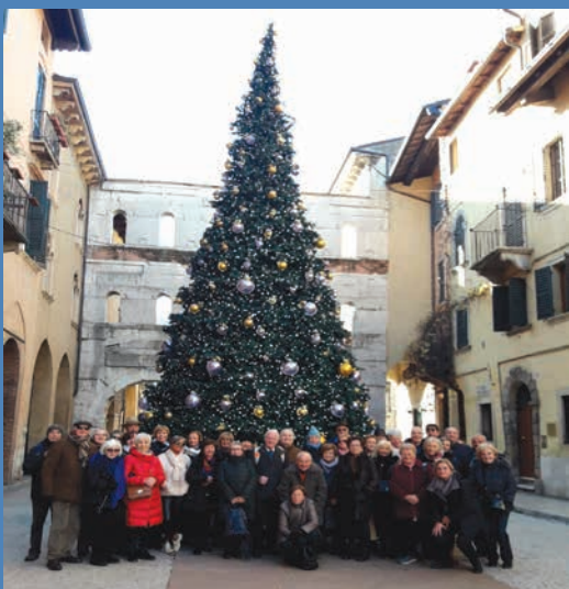
Non è Natale senza la nostra gita alla scoperta dei più bei mercatini di prodotti artigianali tipici. Quest'anno abbiamo scelto la magia di Verona.