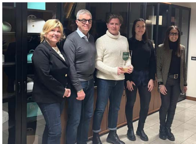
CARTOTECNICA DEL PIN SAS