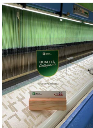
GIUSEPPE MAURI SNC