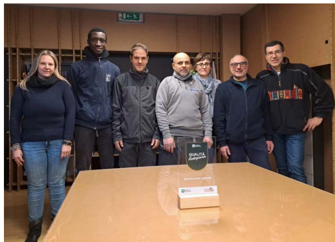
SCATOLIFICIO LARIANO SRL