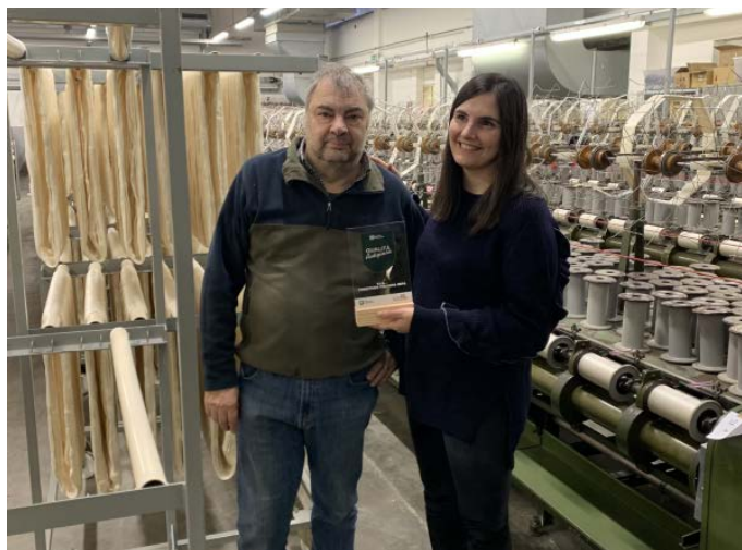
T.I.S. TORCITURA ITALIANA SETA SNC