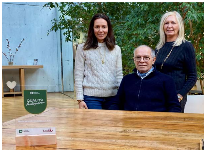
MAGLIFICIO ROSSELLA SRL